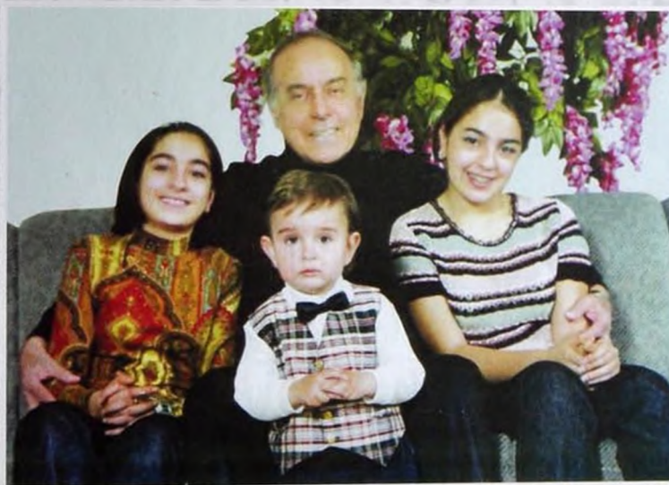
Ulu Öndər Heydər Əliyev nəvələri Leyla, Arzu və Heydər ilə Общенациональный Лидер Гейдар Алиев с внуками Лейлой, Арзу и Гейдаром National leader Heydar Aliyev with his grandchildren: Leyla, Arzu and Heydar.