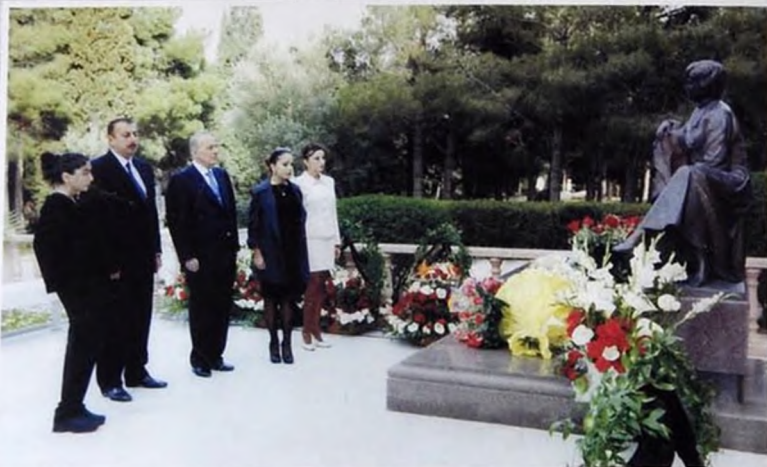
Ulu Öndər Heydər Əliyev öz ailəsi ilə Zərifə Əliyevanın məzarını ziyarət edərkən. Общенациональный Лидер Гейдар Алиев с членами семьи во время посещения могилы Зарифы Алиевой. National leader Heydar Aliyev with his family visiting cemetery of Zarifa Aliyeva.