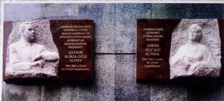
Ulu Öndər Heydər Əliyevin və akademik Zərifə xanım Əliyevanın yaşadıkları binadakı baryeflər.

Барельефы Общационального Лидера Гейдара Алиева и академика Зарифы ханум Алиевой на фасаде дома, в котором они жили. Bas-reliefs of national leader Heydar Aliyev and academician Zarifa khanum Aliyeva on front of building where they lived.