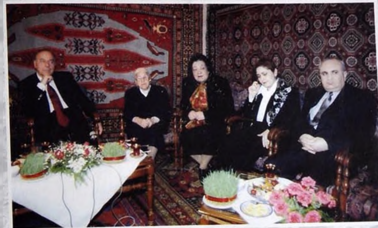
2001 Баки - Баку - Баки