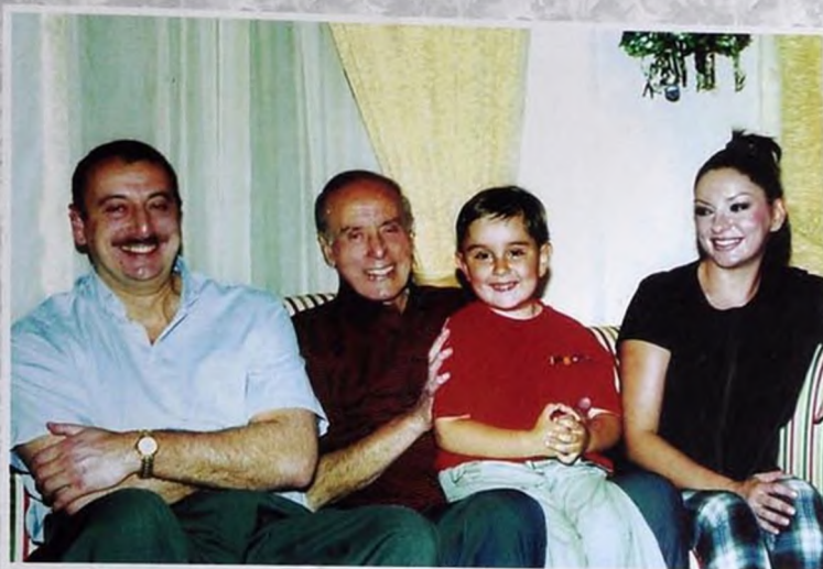
Ulu Öndər Heydər Əliyev ailəsi ilə Общенациональный Лидер Гейдар Алиев в кругу семьи. National leader Heydar Aliyev with his family.