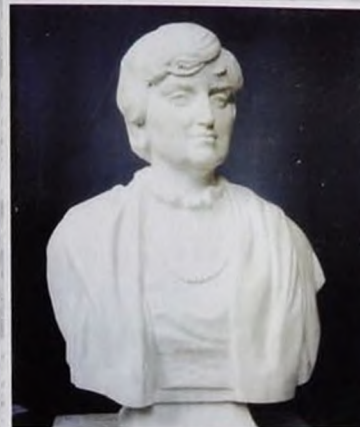
Büst 2003-cü ildə akademik Zərifə xanım Əliyevanın 80 illiyində Z. Ə. Əliyeva adına Elmi-Tədqiqat Göz Xəstəlikləri İnstitutunun kollektivinin sifarişi ilə hazırlanmışdır. В 2003-м году по заказу НИИ глазных болезней им. З. А. Алиевой по случаю 80-летия был изготовлен бюст академика Зарифы ханум Алиевой. In 2003 Research Institute of Eyes Diseases named after Z.A. Aliyeva ordered to make bust of academician Zarifa khanum Aliyeva devoted to 80th anniversary of Z.A. Aliyeva.