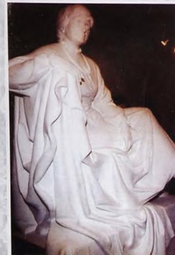
1997 «Elegiya». «Элегия». «Elegy» Heykəltəraş Ömər Eldarov. Скульптор Омар Эльдаров. Sculptor Omar Eldarov.