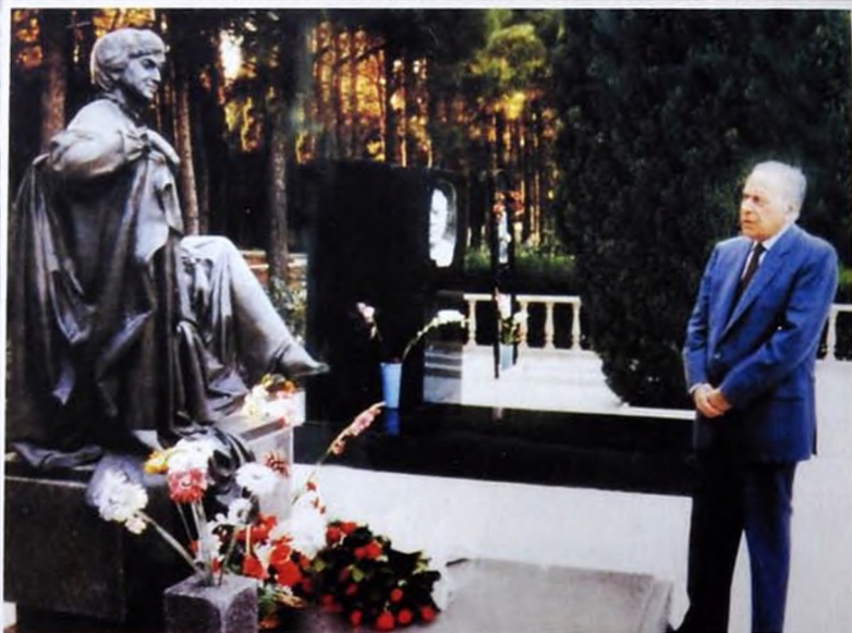
Ulu Öndər Heydər Əliyev Zərifə xanımın məzarını ziyarət edərkən. Общенациональный Лидер Гейдар Алиев во время посещения могилы Зарифы ханум. National leader Heydar Aliyev at cemetery of Zarifa khanum.