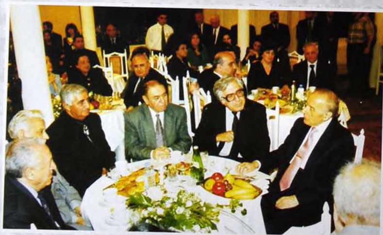
2000 Akademik Zərifə xanım Əliyevanın xatirə günü. Вечер памяти академика Зарифы ханум Алиевой. Party to memory of academician Zarifa khanum Aliyeva.