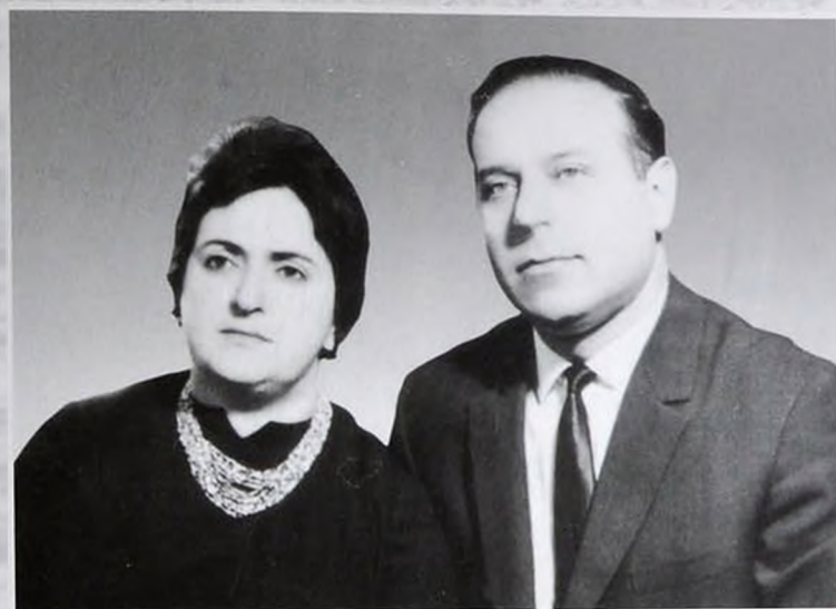
ZƏRİFƏ XANIM VƏ HEYDƏR ƏLİYEV ЗАРИФА ХАНУМ И ГЕЙДАР АЛИЕВ ZARIFA KHANUM AND HEYDAR ALIYEV