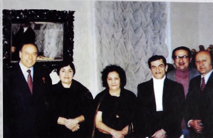
HEYDƏR ƏLİYEV VƏ ZƏRİFƏ XANIM MƏDƏNİYYƏT XADİMLƏRİ İLƏ GÖRÜŞƏRKƏN ВСТРЕЧА ГЕЙДАРА АЛИЕВА И ЗАРИФЫ ХАНУМ С ДЕЯТЕЛЯМИ КУЛЬТУРЫ HEYDAR ALIYEV AND ZARIFA KHANUM AT THE MEETING WITH PERSONS OF CULTURE