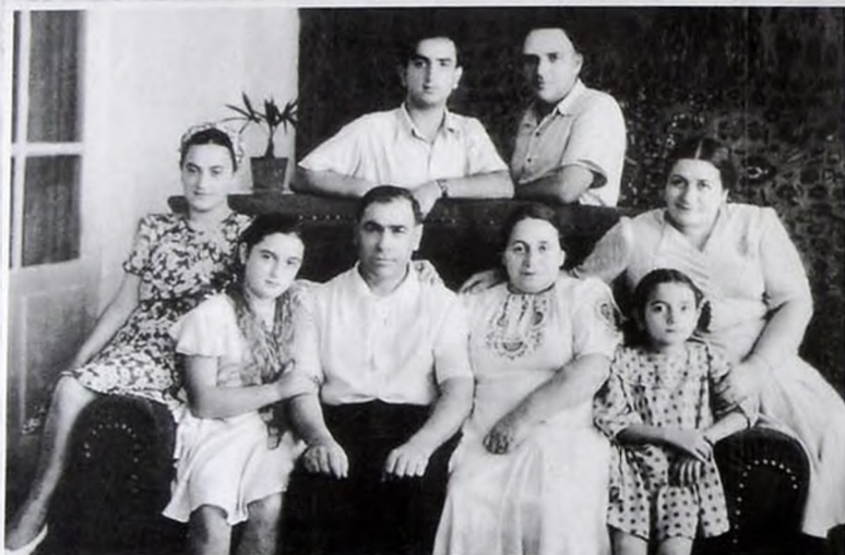
1947 Ваки - Баку - Ваки