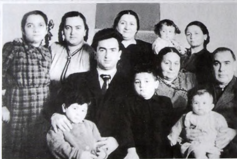
1953 Ваки - Баку - Ваки