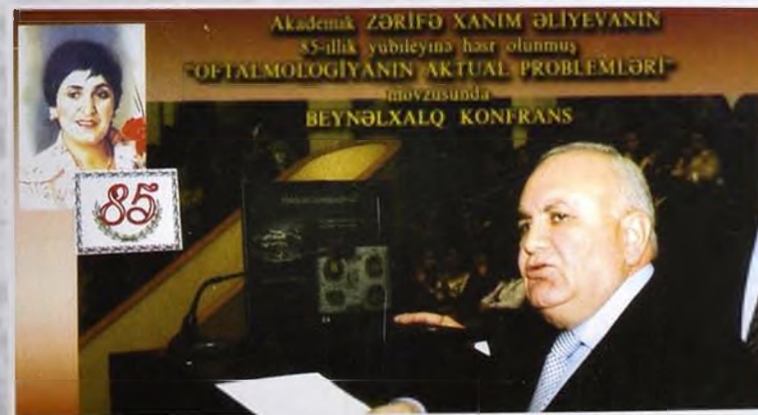
2008 Ваки · Баку · Ваки Международная конференция на тему «Актуальные проблемы офтальмологии», посвященная 85-летию академика Зарифы ханум Алиевой. International Conference "Today's problems of ophthalmology" devoted to 85th anniversary of academician Zarifa khanum Aliyeva.