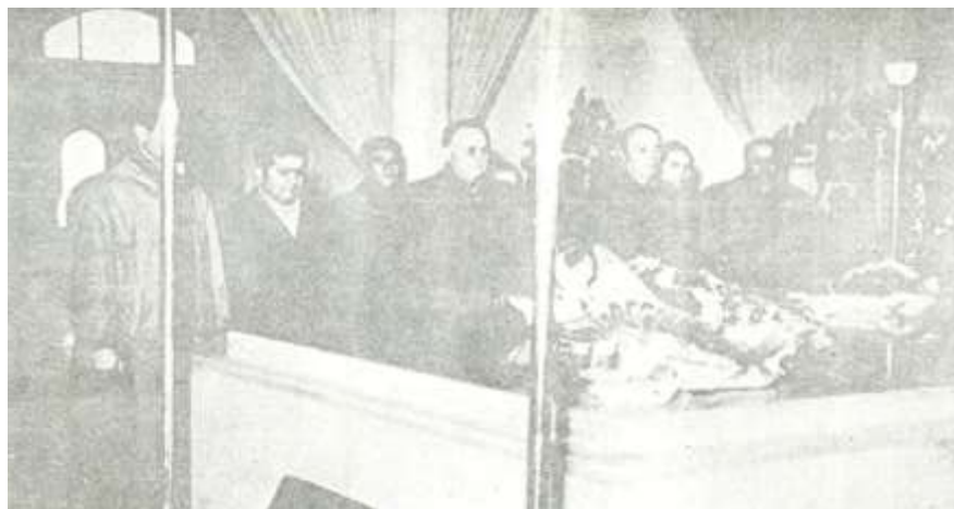
M.Ə.Rəsulzadə Atatürkün məzarını ziyarət edir.