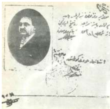
M.Ə.Rəsulzadəyə silah gəzdirmək üçün verilən sənəd.