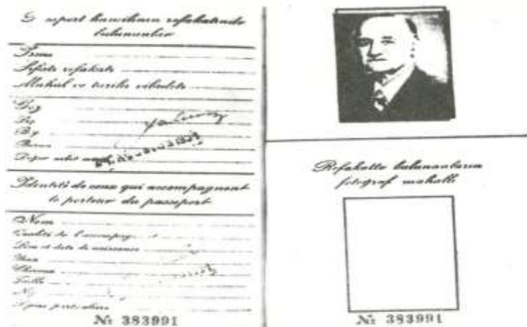
M.Ə.Rəsulzadənin xaricə getmək üçün pasportu.