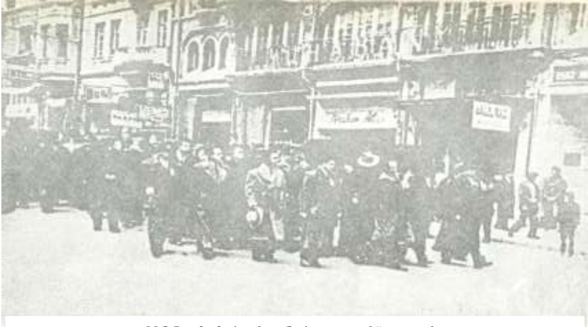
M.Ə.Rəsulzadənin tabutu Əsri məzaristanlığına aparılır.