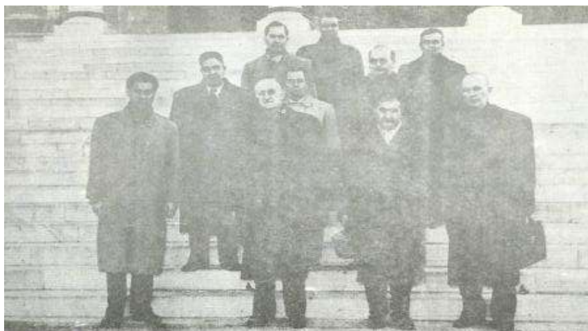
M.Ə.Rəsulzadə Türkiyədə yaşayan Azərbaycanlı dostları ilə.