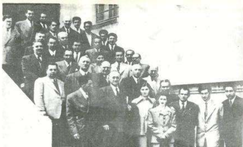
M.Ə.Rəsulzadə azərbaycanlı mühacirlər arasında.