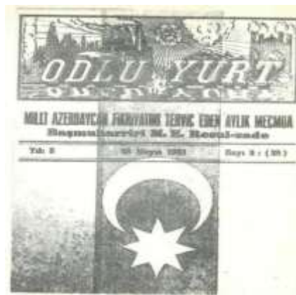
M.Ə.Rəsulzadənin İstanbulda nəşr etdiyi "Odlu yurd" jurnalı.