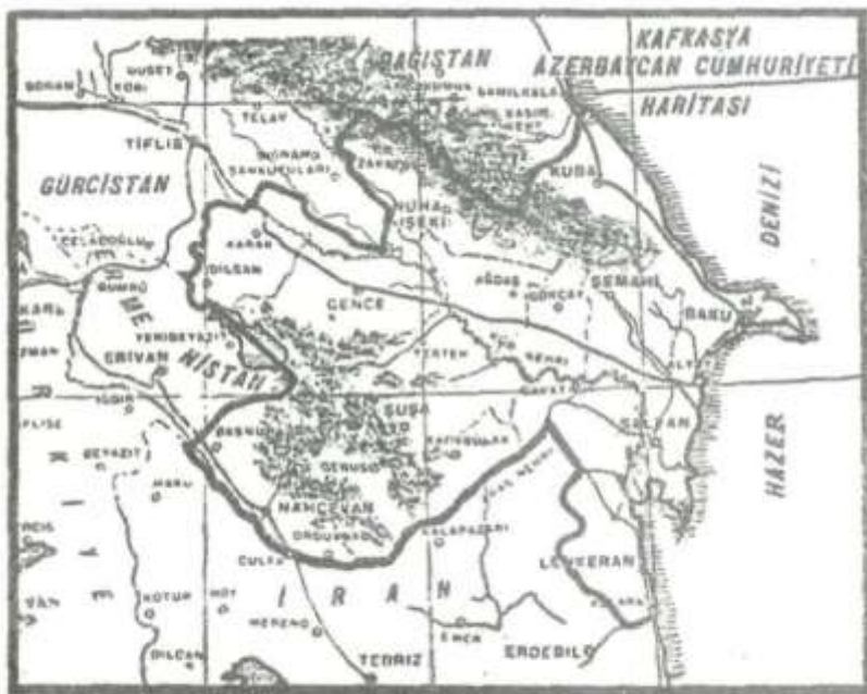
Azerbaycan Cumhuriyeti haritası

M.Ə.Rəsulzadənin Ankarada nəşr etdiyi "Azərbaycan" jurnalı.