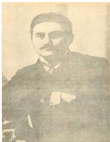
M.Ə.Rəsulzadə gənclik çağında.