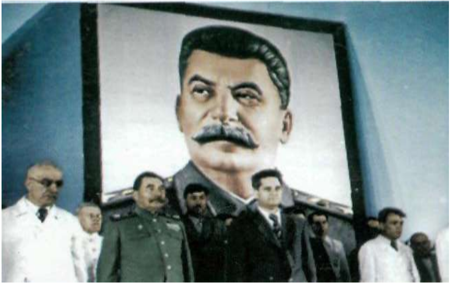
M.C.Bağırov Sovet İttifaqı Marşalı S.Budyonni ilə birlikdə, Bakı, 1952.