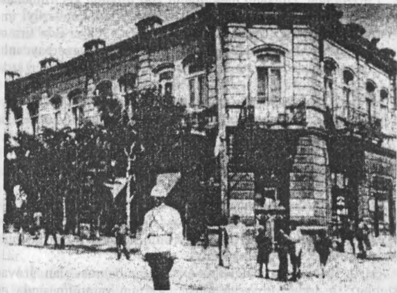
İrəvan gimnaziyasının binası, 1881

1881-ci ildə azərbaycanlıların əski mədəni mərkəzlərindən biri olan İrəvan şəhərində İrəvan gimnaziyası və İrəvan Müəllimlər Seminariyası fəaliyyətə başladı. Yeri gəlmişkən xatırlatmaq lazımdır ki, böyük Mirzə Cəlil vaxtıyla dərs dediyi Uluxanlı məktəbinin əsası da həmin ildə qoyulmuşdur.