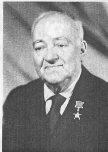
Mustafa bəy Topçubaşov

Mustafa bəy Ağa bəy oğlu Topçubaşov – 1895-ci ildə avqust ayının 5-də İrəvanda anadan olmuşdur. O, əvvəlcə İrəvan şəhərinin Daşlı məhəlləsində yerləşən İbadulla bəy Muğanlinskinin pansionatında təhsil almışdı. Burada qardaşı Mehdi bəy və gələcəyin görkəmli ədəbiyyatşünas alimi Əziz Şəriflə bir sinifdə oxuyan Mustafa bəyə o zaman İrəvanın tanınmış ziyalıları Mirzə Abbas Məmməd-zadə (Fars Abbas), İbadulla bəy Muğanlinski, Cabbar Məmməd-zadə kimi böyük şəxsiyyətlər dərs deyirlər. 1914-cü ildə İrəvan gimnaziyasını qızıl medalla bitirən Mustafa bəy Kiyev Dövlət Universitetinin Tibb fakültəsinə daxil olub və 1919-cu ildə təhsilini başa vurub Bakıya qayıtmışdı. O, 1926-30-cu illərdə Almaniyada iş təcrübəsi keçmiş, 1930-cu ildə doktorluq dissertasiyasını müdafiə edir. 8 il sonra o, efir-yağ ağrısızlaşdırmasını – uzun müddətli analgeziyanı kəşf etməklə tibb elmində yeni bir səhifə açır. 1943-cü ildə Mustafa bəy SSRİ Dövlət mükafatına layiq görülmüş və iki il sonra Azərbaycan Elmlər Akademiyasının ilk akademiklərindən biri seçilmişdir.