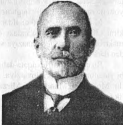
Firudin bəy Köçərli

Əldə olan məlumatlar Köçərlinin İrəvan həyatının çox dolğun keçdiyini təsdiq edir: “1885-ci ilin iyun ayında Köçərli İrəvan gimnaziyasına Azərbaycan dili və şəriət müəllimi təyin olunur. Pedaqoji işdə böyük müvəffəqiyyət göstərdiyi üçün o, demək olar ki, hər il mükafat alır, ona “kollejski sekretar”, “titulyar sovetnik”, “ştat-ski sovetnik” kimi rütbələr verilir.