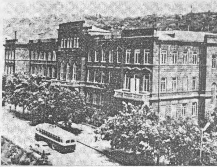
İrəvan Müəllimlər Seminariyasının binası

1828-ci ildə İrəvan xanlığı süquta uğradıqdan sonra qədim İrəvan dövrün ab-havasına uyğun inkişaf etməyə başladı. Şəhərdə dəyişikliklər olsa da, bunlardan ikisini xüsusi qeyd etmək lazımdır: “İrəvan gimnaziyası” və “İrəvan Müəllimlər Seminariyası”.