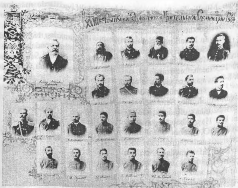
İrəvan Müəllimlər Seminariyasının XVIII buraxılışı – 1901/1902