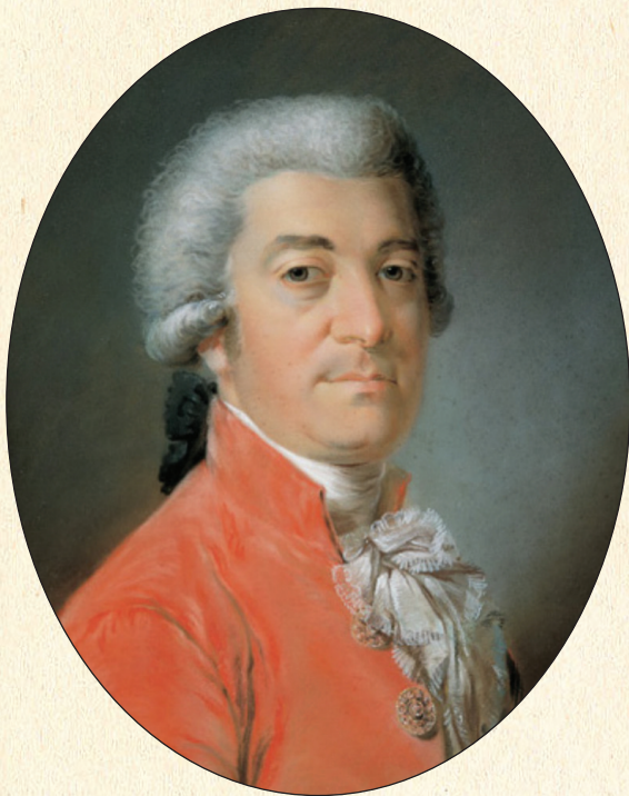
Гъайнрих Фридрих фон Диц